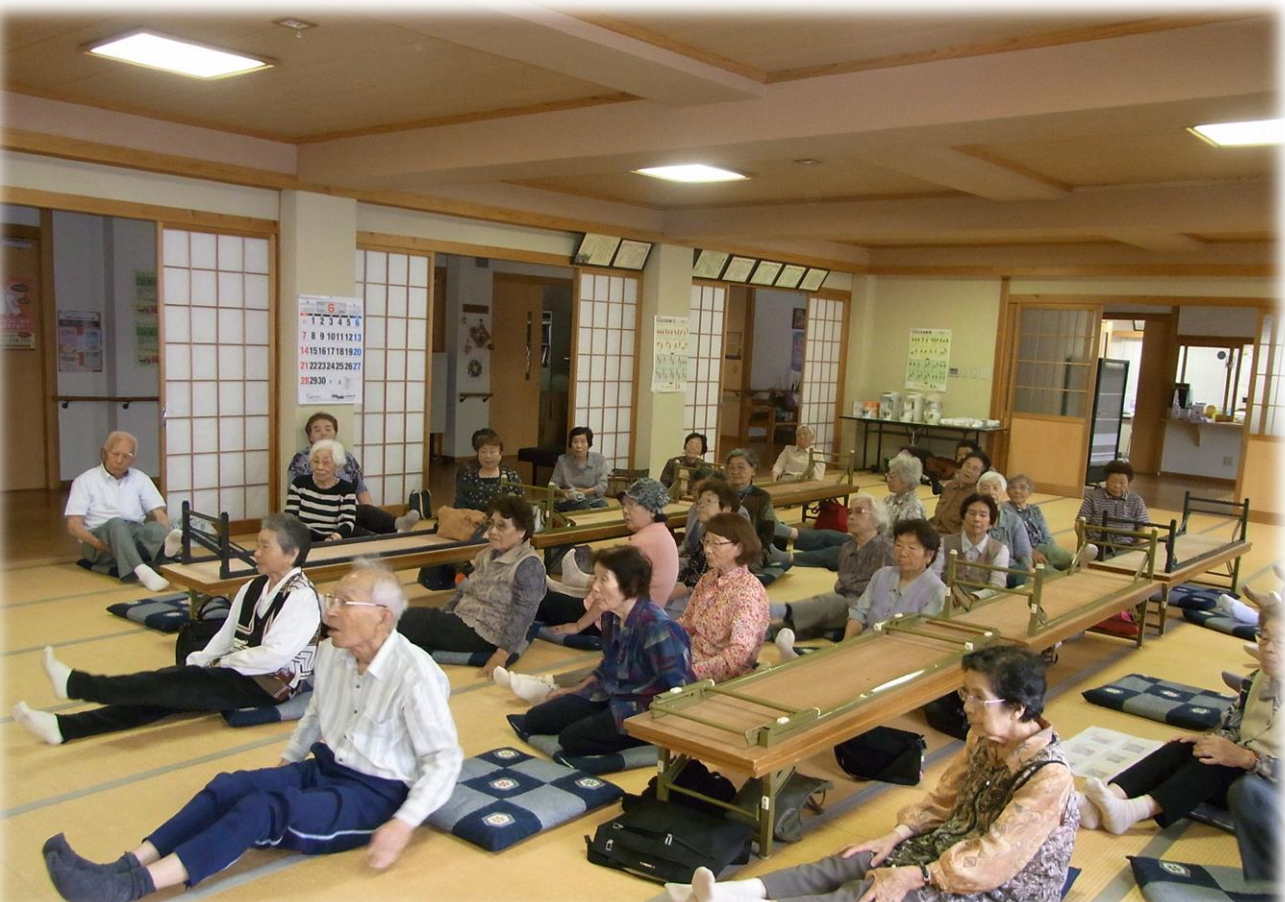
♪上記写真は、【北国の春】の曲に合わせて体操を行っている様子です♪

甲佐町社会福祉協議会 〒861-4601 甲佐町岩下 24 TEL 096-234-1192 FAX 096-235-3081 E-mail info@kosa-shakyo.or.jp